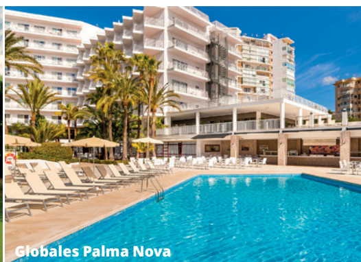
Globales Palma Nova