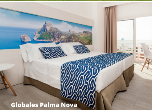
Globales Palma Nova