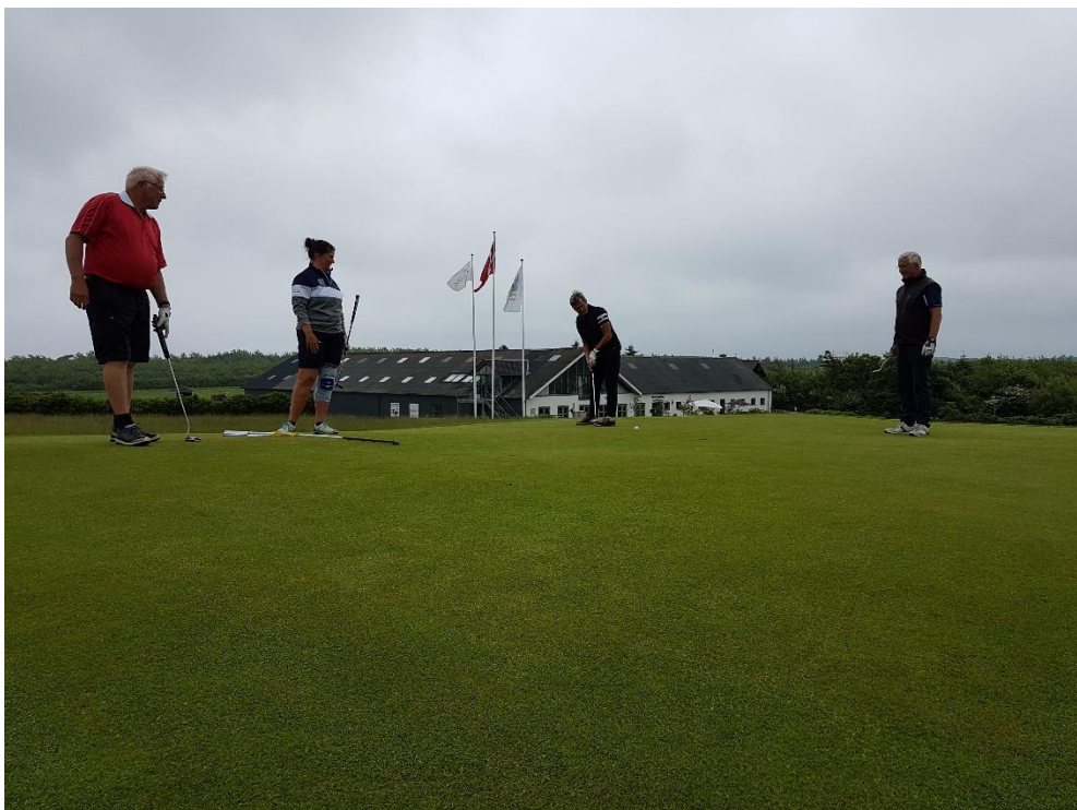
Koncentration på green - hul 6