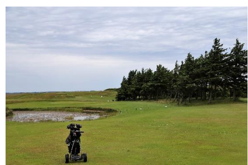
Klar til indspil over søen