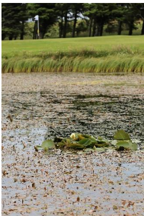
Åkander i søen