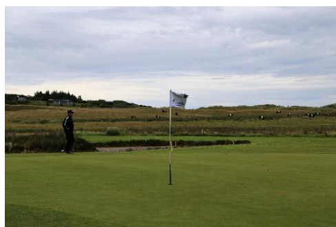
Green med udsigt til overdrevet