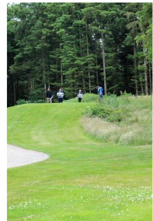
Teested set fra fairway