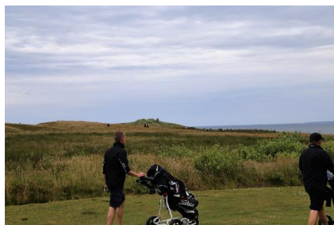
Spiller med overdrevet i baggrunden