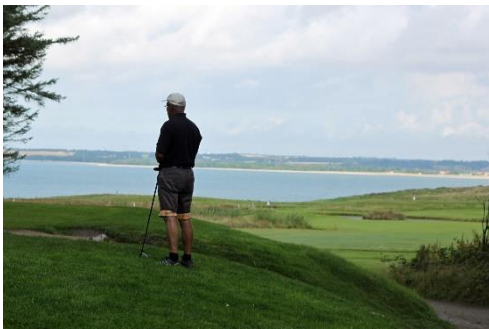
Udsigten fra teestedet