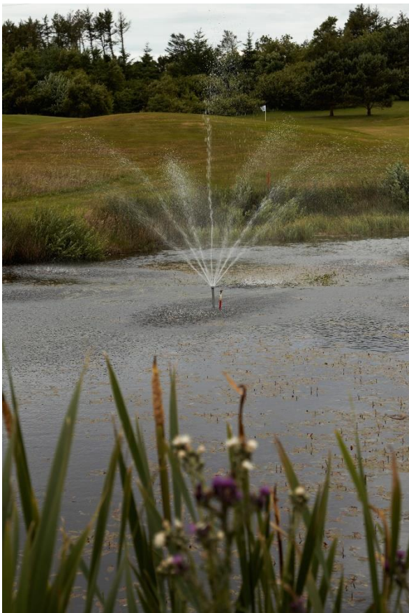
Søen med springvandet