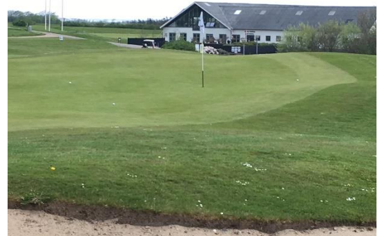
Green med Thagaard i baggrunden