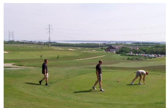
Forberedelser til udslag