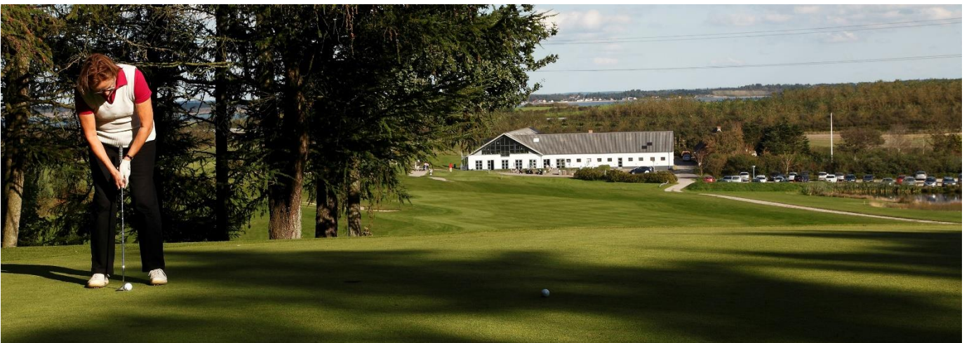
Det gode put med fairway og klubhus i baggrunden