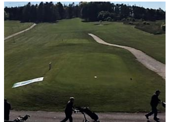
Teestederne lige uden for klubhuset